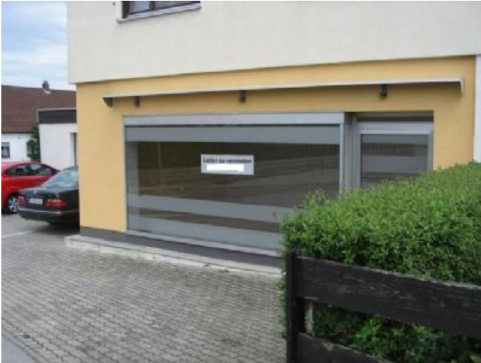
Ansicht von der Straße aus