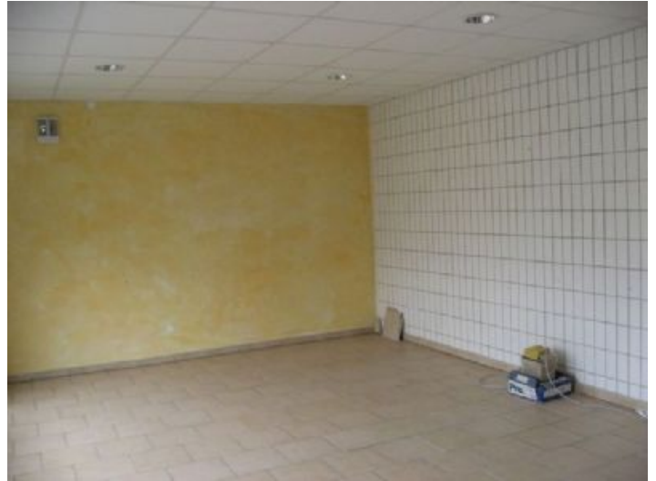
Verkaufsraum (Schaufenster) zur Straße