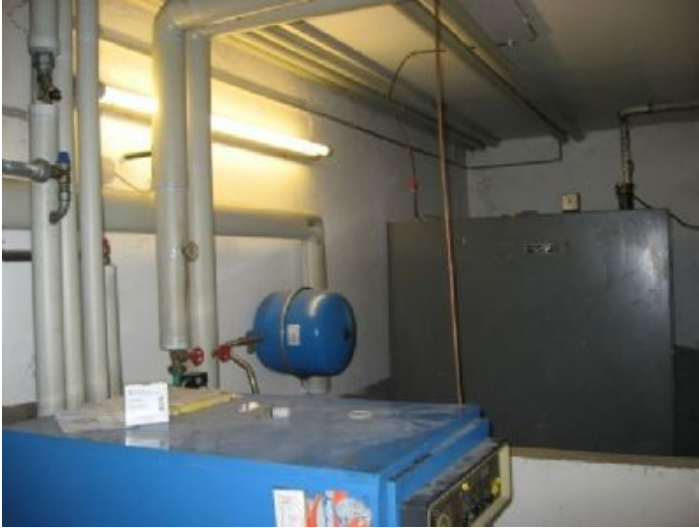
Heizung für beide Häuser