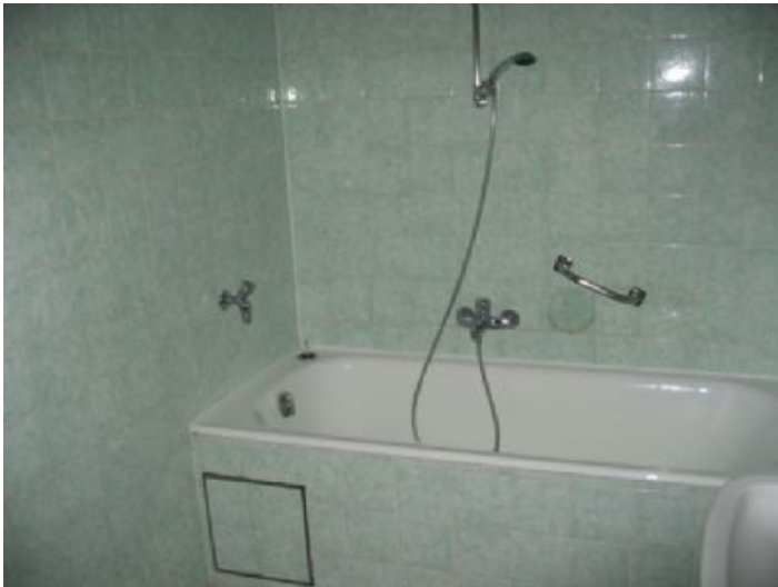
...und Badewanne / Waschmaschinenanschluß