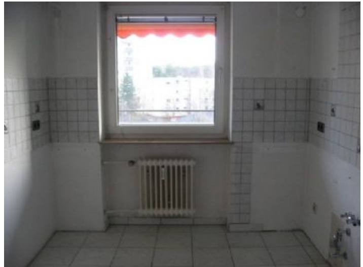
Küche mit Fliesenspiegel grau

Alle Angaben in diesem Exposé wurden nach bestem Wissen und Gewissen des Eigentümers gemacht. Die Firma Immobilien Rappel kann keine Gewährleistung für die Richtigkeit und Vollständigkeit der Angaben übernehmen.