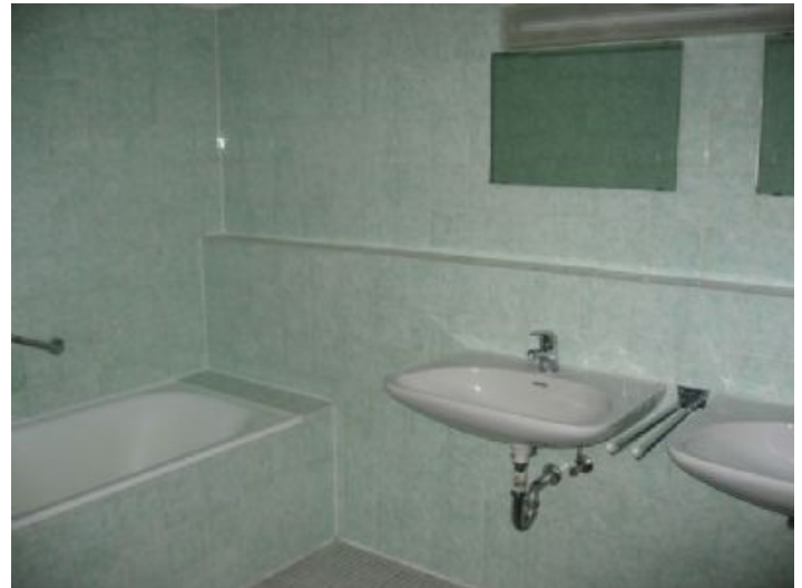
Innenliegendes Bad mit zwei Waschbecken...

Alle Angaben in diesem Exposé wurden nach bestem Wissen und Gewissen des Eigentümers gemacht. Die Firma Immobilien Rappel kann keine Gewährleistung für die Richtigkeit und Vollständigkeit der Angaben übernehmen.