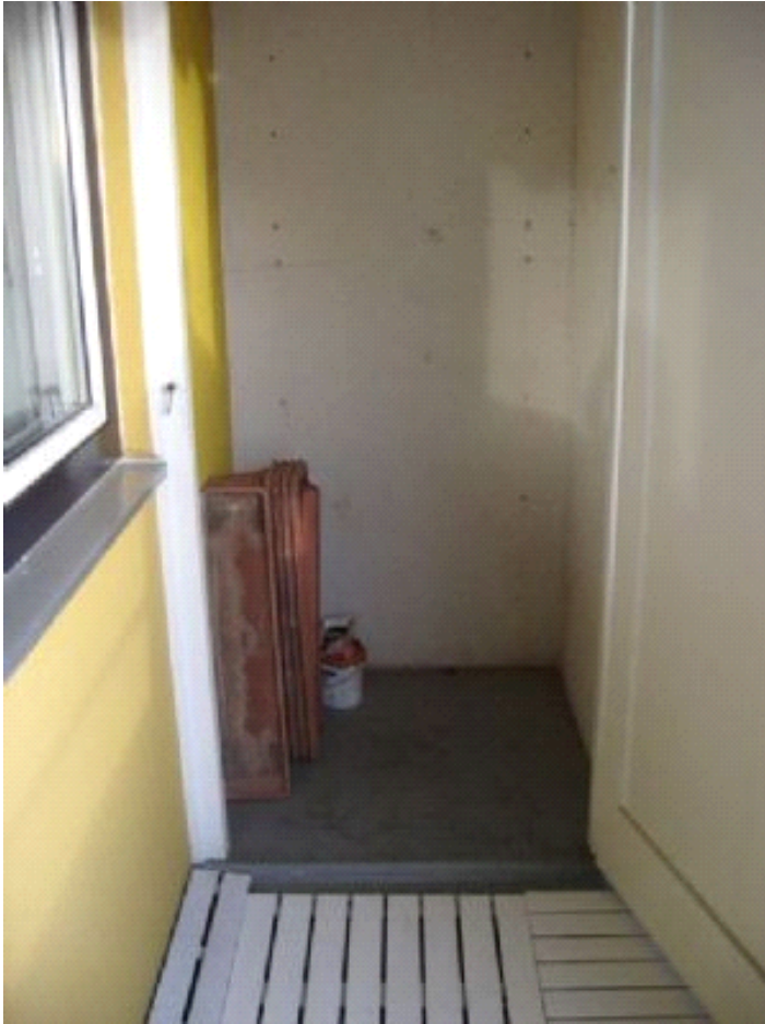
vom Balkon aus in den Abstellraum

Alle Angaben in diesem Exposé wurden nach bestem Wissen und Gewissen des Eigentümers gemacht. Die Firma Immobilien Rappel kann keine Gewährleistung für die Richtigkeit und Vollständigkeit der Angaben übernehmen.